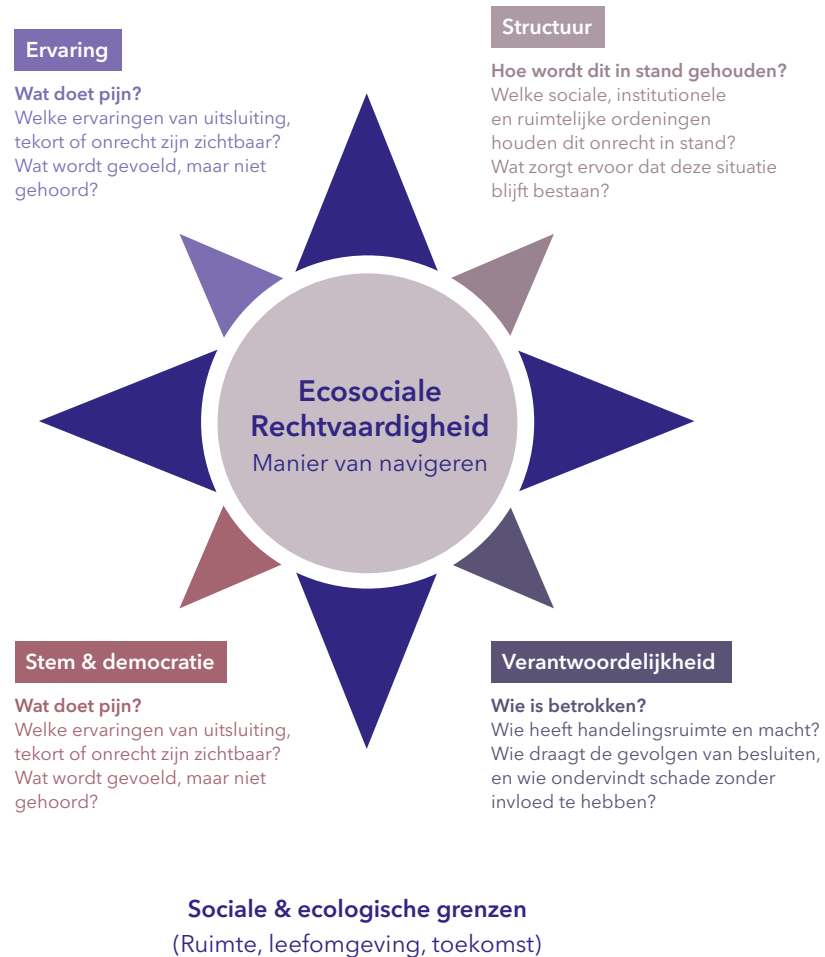
Figuur 2: Ecosociaal rechtvaardigheidskompas