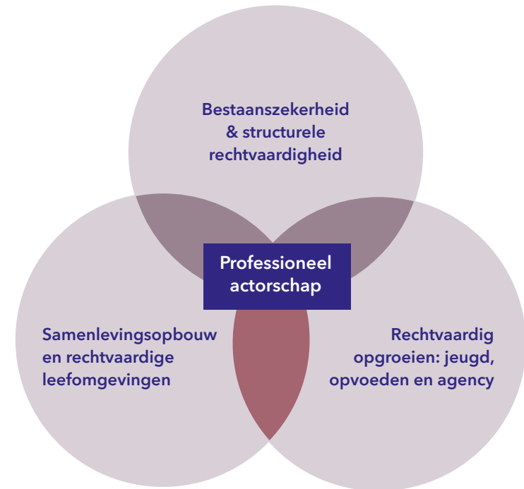
Figuur 4: Ecosociale rechtvaardigheid en de samenhang van maatschappelijke opgaven in sociaal werk